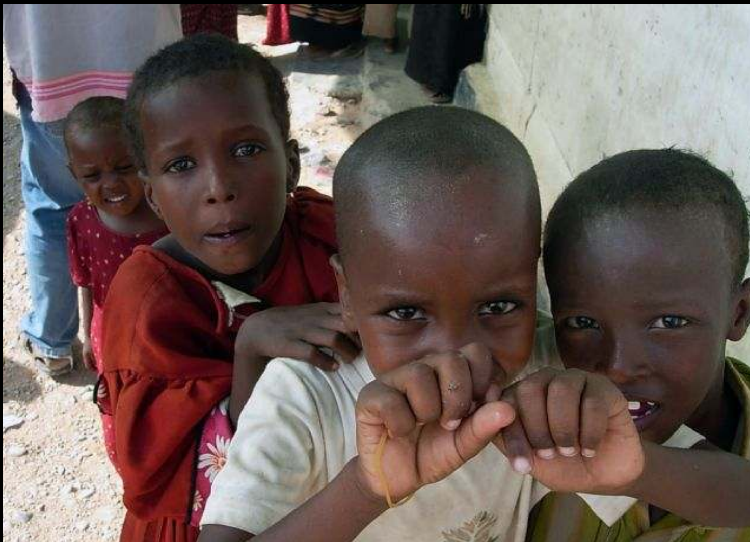
Somalia 2007