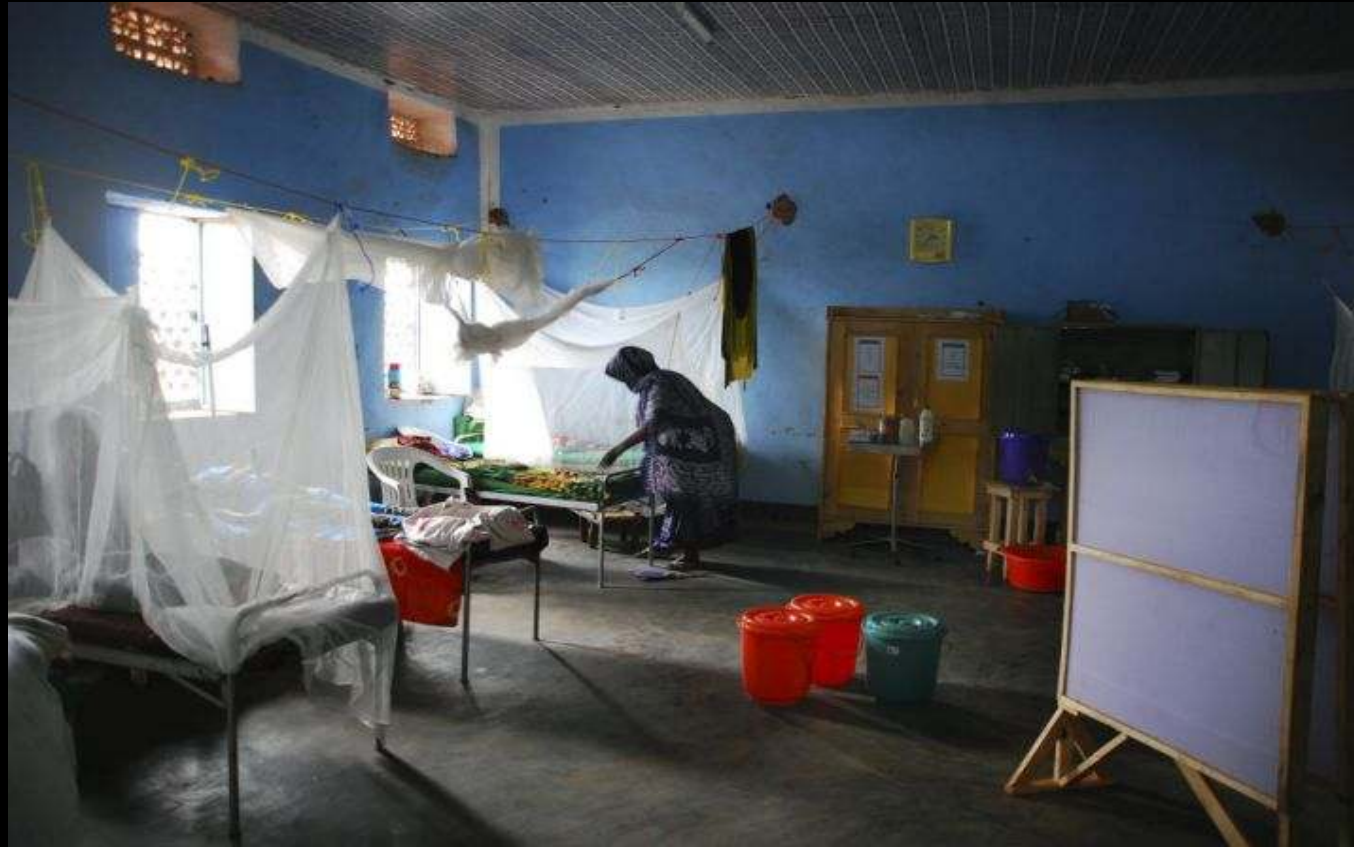
Somalia 2006

MSF soutient l'hôpital Istarlin dans la région Guriel, dans le but d'améliorer les soins des enfants de moins de cinq ans, en fournissant les matériaux médicaux et en formant les docteurs généralistes somaliens.