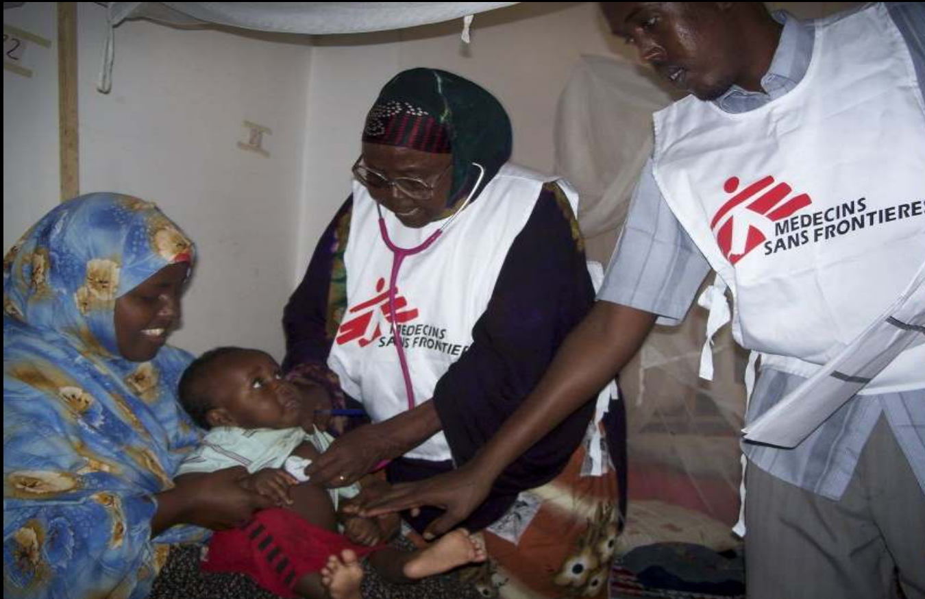
Somalia 2009

Le personnel médical à Istarlin est confronté à un manque de formation continue et à un manque de supervision. L'unité pédiatrique ne dispose pas de pédiatres.